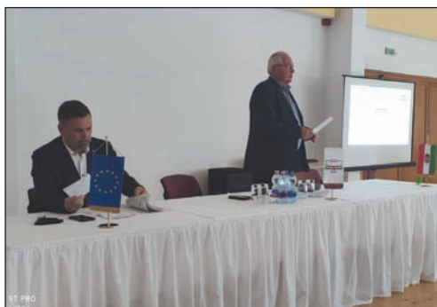
Első napon a nyitó előadást a FILANTROP

Először egy általános helyzetképet kaptunk a kéményseprőipar jelenlegi helyzetéről: sokszor nehéz eldönteni, mikor, kihez tartozik pl. a társasházban a szolgáltatás: katasztrófavédelem vagy kéményseprőipari szolgáltató.