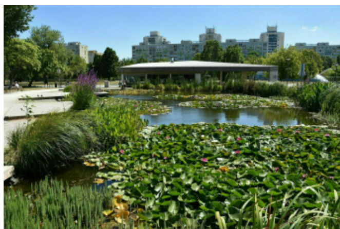
Önfenntartó tó a XI. kerületben

A verseny díjazásától függetlenül, a település – a kialakult arculata alapján – mindig nyertes!